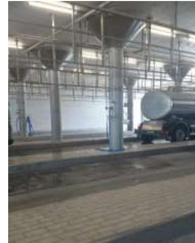
Site de coulage ou depôt