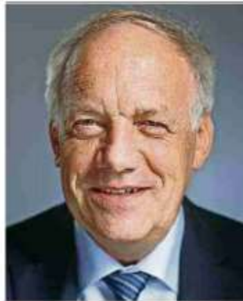
Johann N. Schneider-Ammann

Der Bundesrat und das Parlament sind, wie ich überzeugt: Die Ernährungssicherheit der Schweizer Bevölkerung kann nur gewährleistet werden, wenn der Bund internationale Verbindungen stärkt und schafft. Unser Land ist von Importen abhängig - nicht nur von Lebensmit-